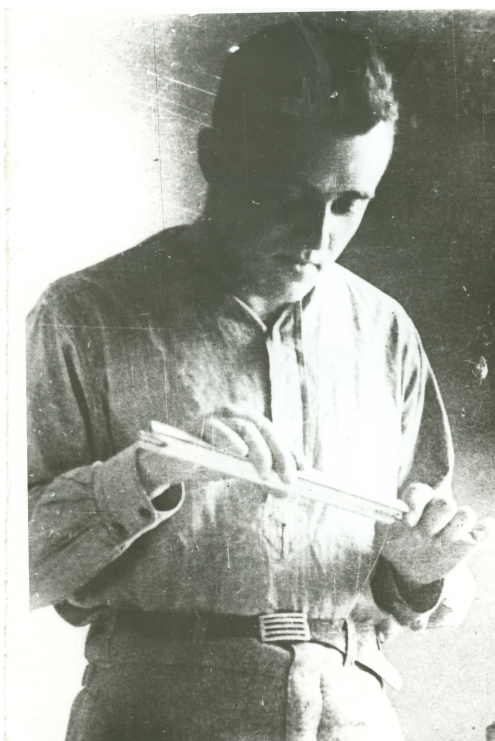
С.П. Королев — студент МВТУ, 1929 г., работа над дипломным проектом