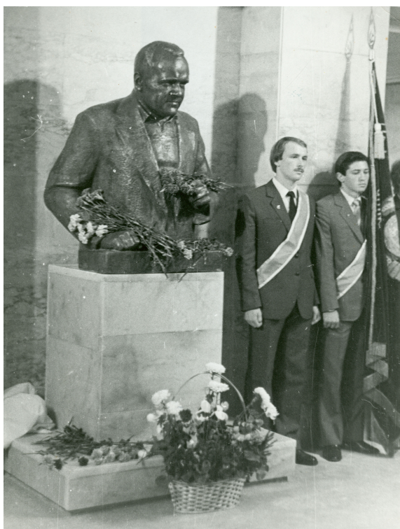
Скульптурный портрет С.П. Королева, установленный в корпусе факультета «СМ» МГТУ им. Н.Э. Баумана